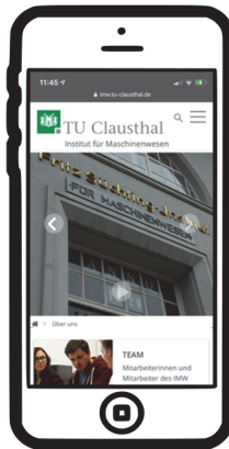
Abbildung 2: Aufbereitung der Inhalte für ein mobiles Endgerät